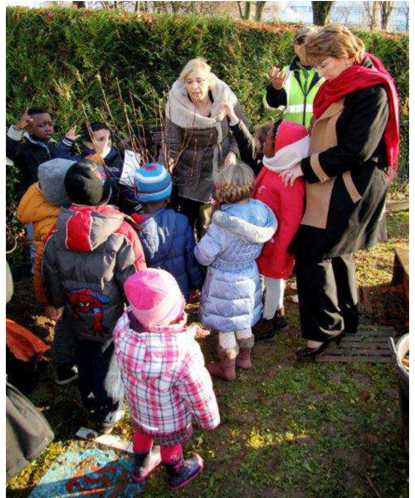
PLANTATION DE L'ARBRE DE LA LAÏCITE AVEC MADAME LA MAIRE