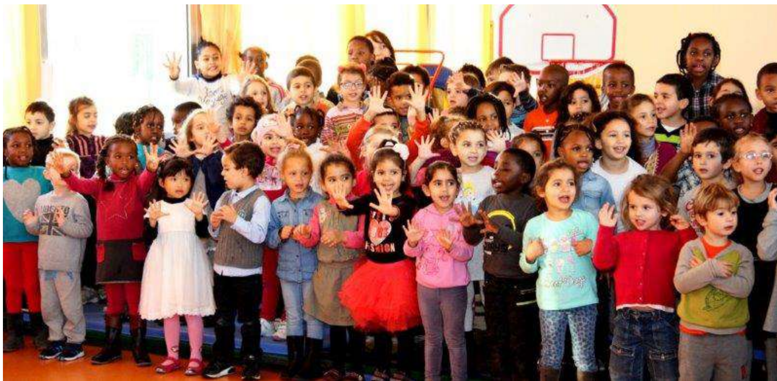
Ecole maternelle La Fontaine Athis-Mons