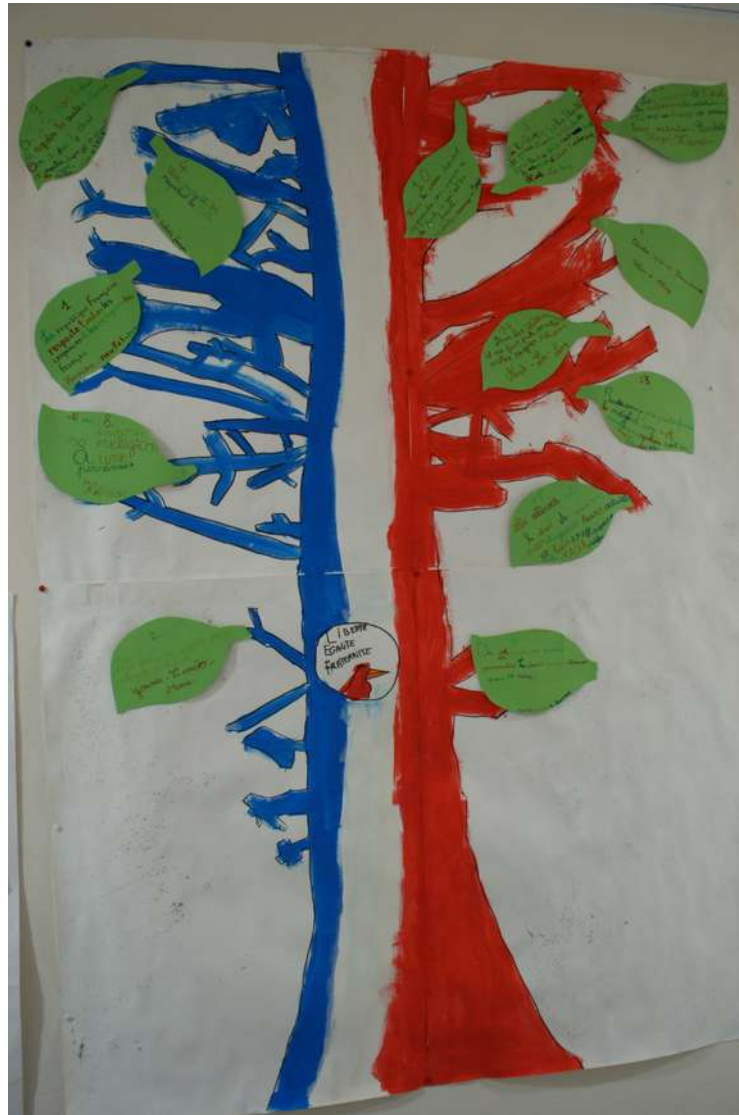
Ecole primaire Jean-Baptiste de LA SALLE Athis-Mons