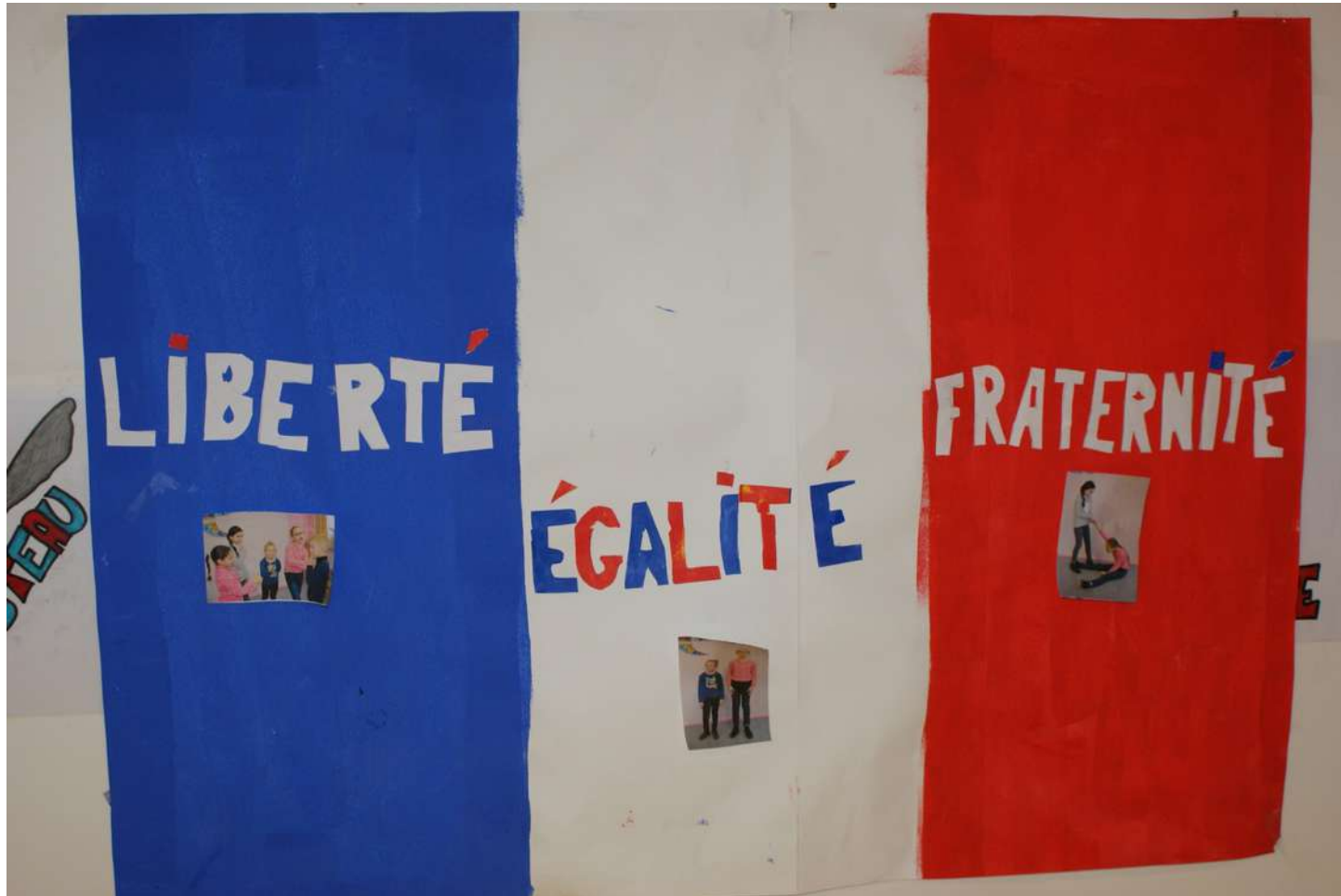
Ecole élémentaire Camille Flammarion Athis-Mons